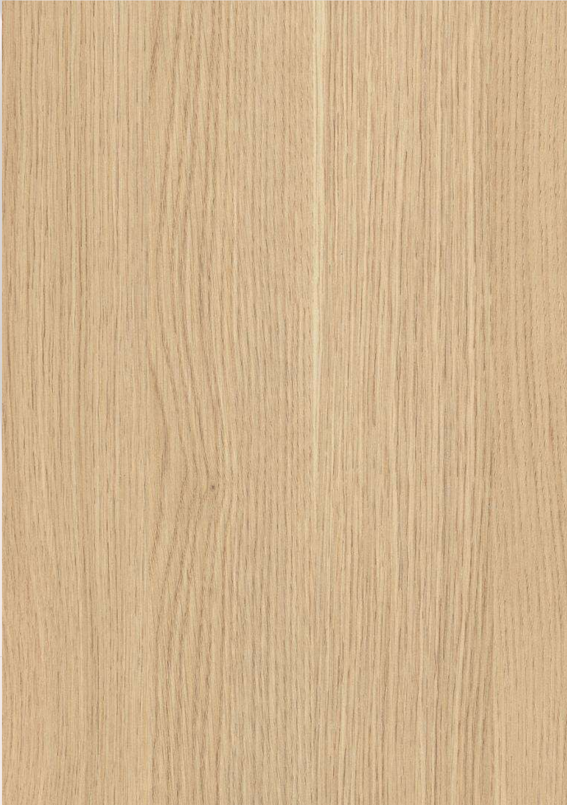
2 ROBLE KAISERSBERG