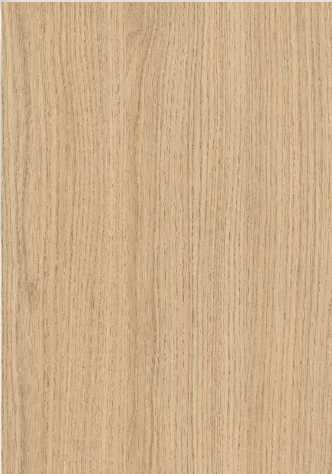
5 ROBLE VICENZA