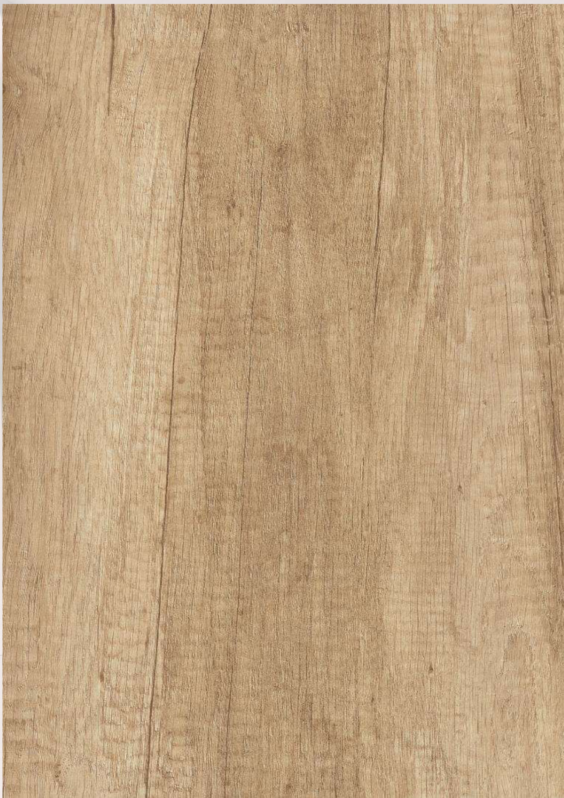
3 ROBLE NEBRASKA NATURAL