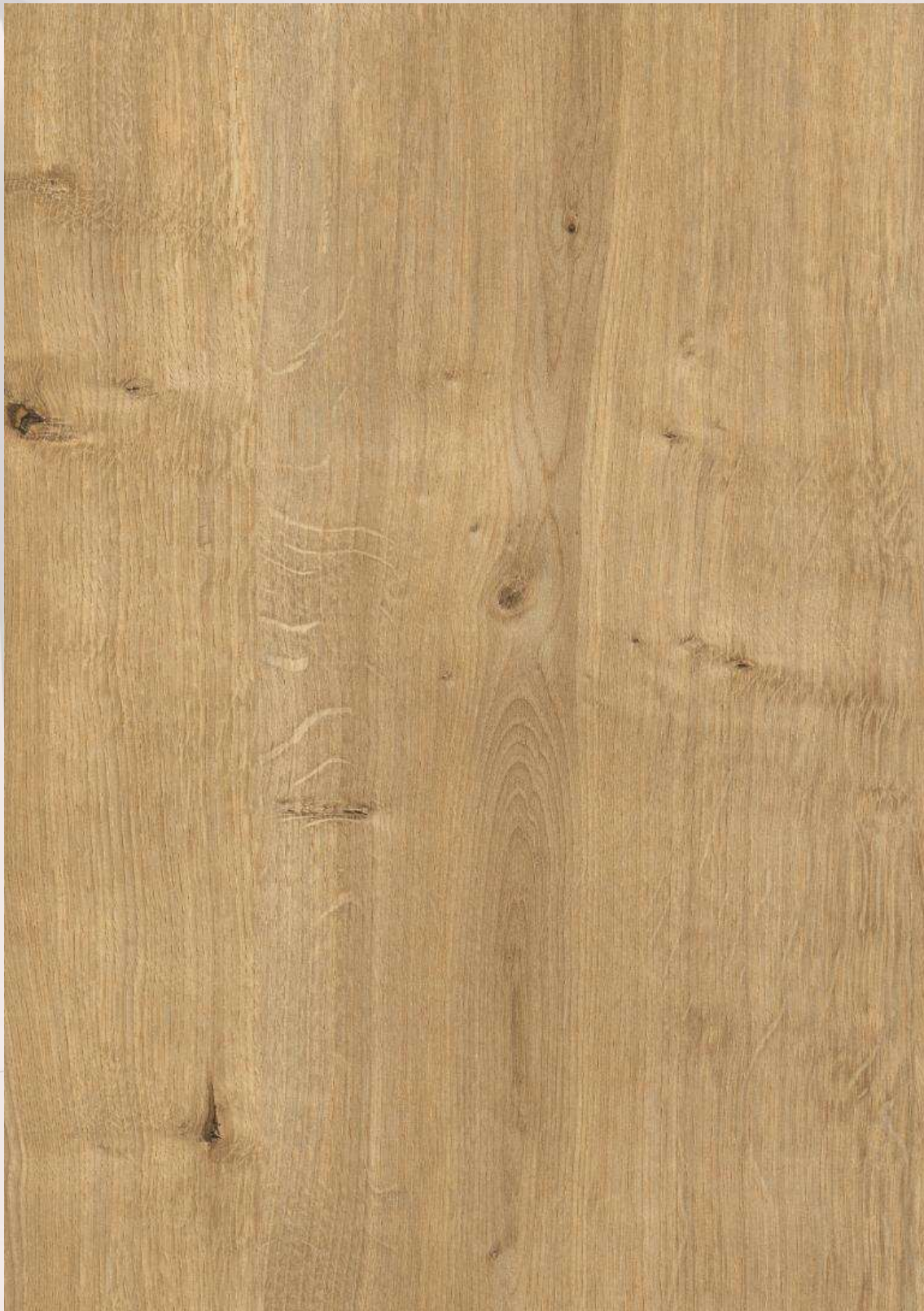
1 ROBLE HAMILTON