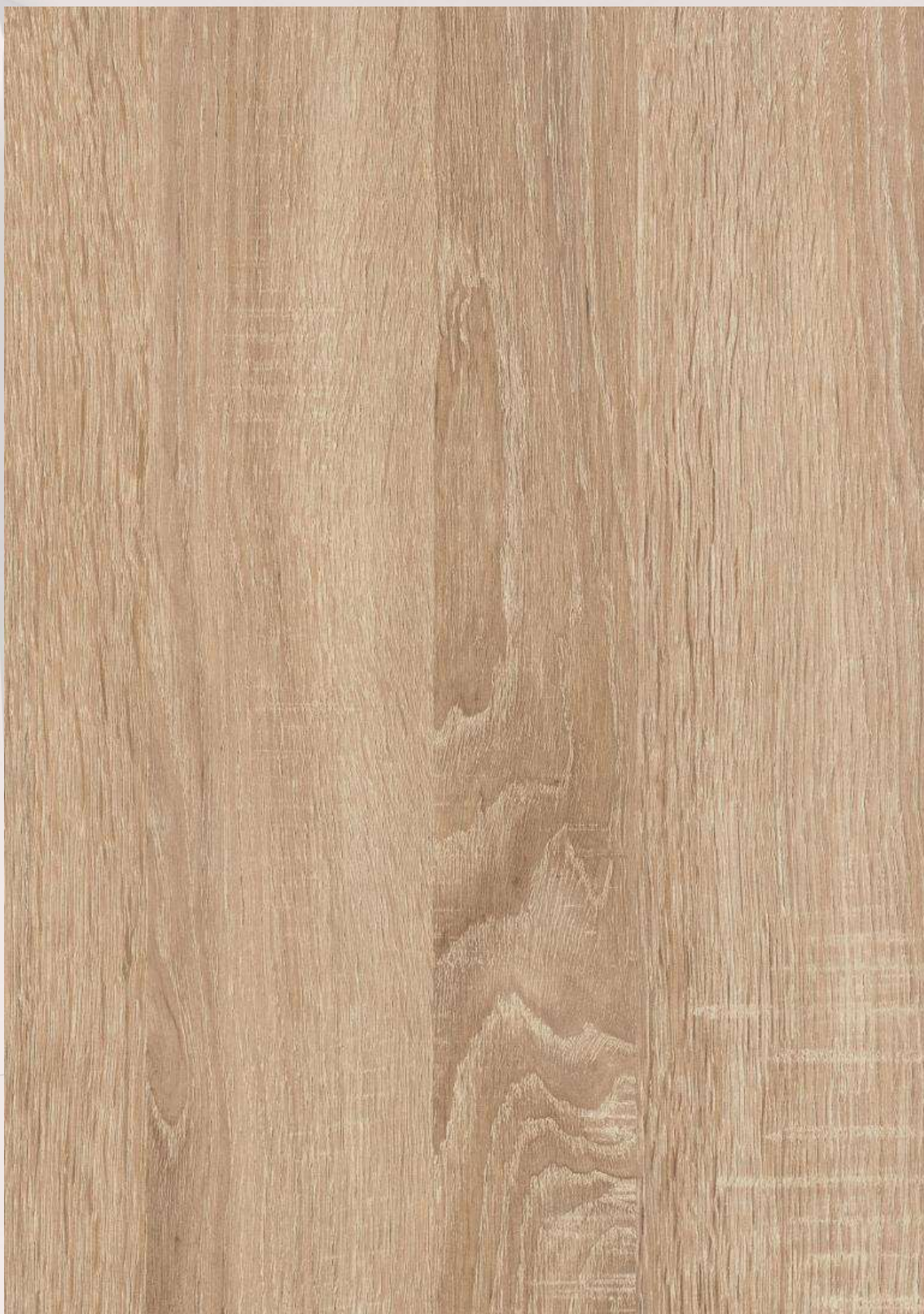
1 ROBLE BARDOLINO NATURAL