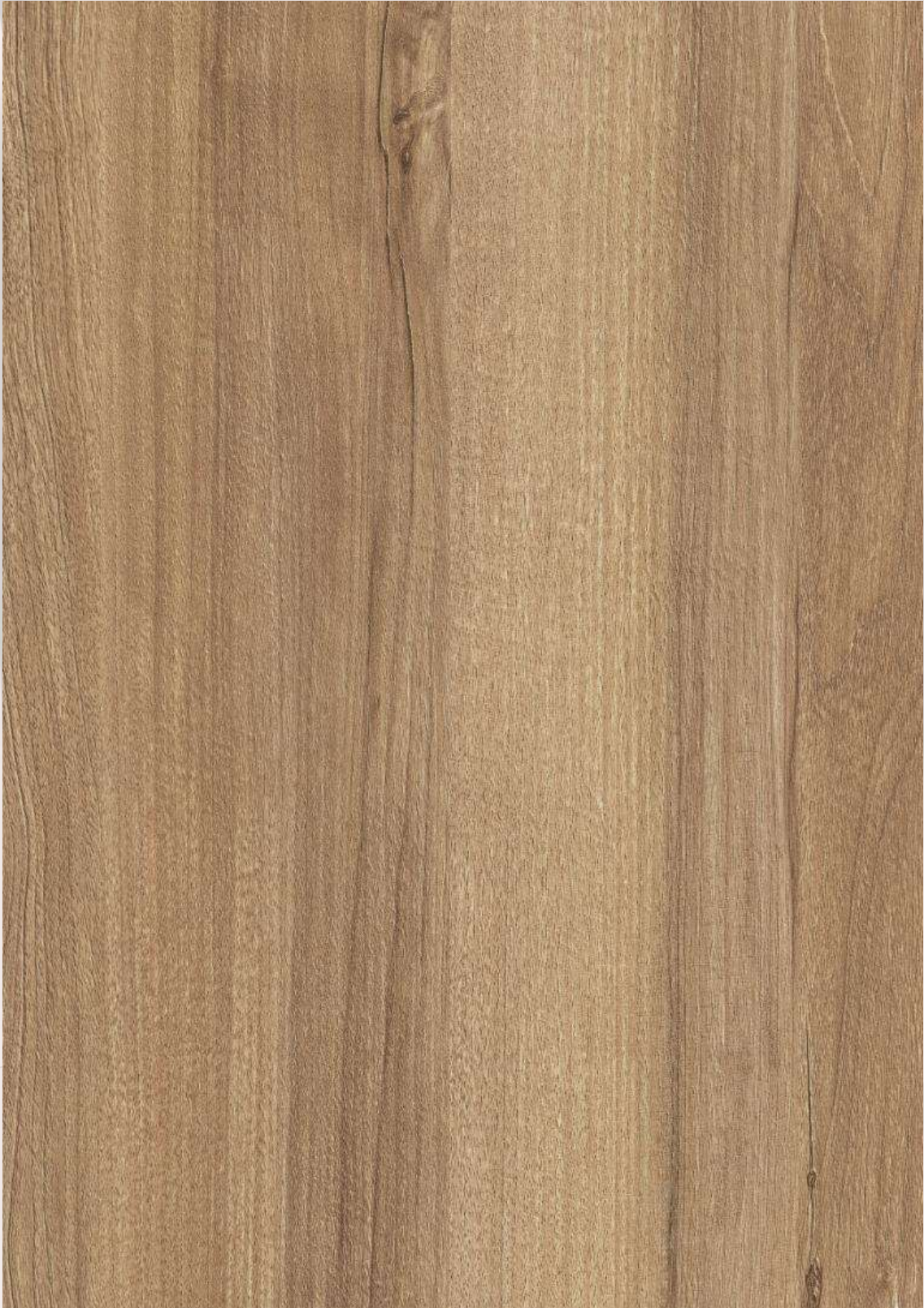
6 NOGAL DEL PACIFICO